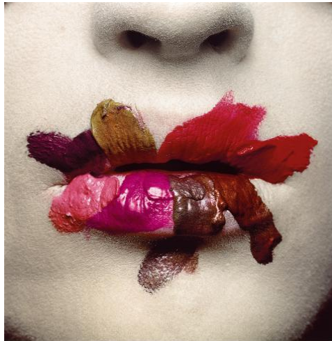
Irving Penn Bouche 1986