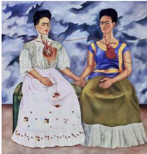
Les deux Fridas 1939

La métamorphose est l'un des fils souterrains du spectacle. À la manière des récits de Kafka ou du cinéma de Cronenberg, le corps y devient le lieu où s'inscrivent les héritages, les violences et les transformations. Mais ici, cette mutation n'est pas seulement une altération : elle ouvre la possibilité d'une réinvention. Avec Carmenita Douc, le personnage choisit de fabriquer sa propre métamorphose. Comme dans l'œuvre de Frida Kahlo, le corps n'est pas le lieu de la seule souffrance ; il devient le support d'une réinvention de soi, où les blessures, les héritages et les fractures ne sont pas dissimulés mais intégrés à une nouvelle image.